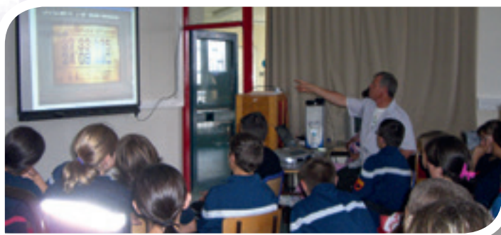
Jeunes Pompiers : cours au collège