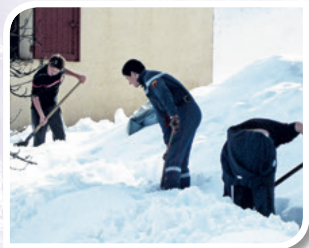
Jeunes Pompiers : aide au déneigement dans le village.

Pour un jeune, la caserne est un lieu riche en points d'intérêts. C'est d'abord le milieu, l'environnement qui attirent, puis ils découvrent l'ambiance, les véhicules d'incendie et de secours qui les ont fait rêver, la tenue d'intervention déjà vue à la télé sur le dos des héros des films de leurs jeunes années.