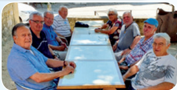
Les dirigeants du Gard lors de leur dernière réunion.