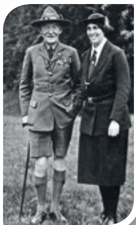
Robert et Olave BADEN-POWELL

Dans la France des années 1920, l'éducation des garçons et filles était strictement séparée et les Scouts de France ne regroupaient donc que des garçons. Mais l'intérêt suscité par cette fondation conduisit dès 1923 à la fondation d'un mouvement de filles, les Guides de France. Alors qu'en Grande-Bretagne, Olave Baden-Powell , épouse du fondateur, développait les Girl Guides , en France,