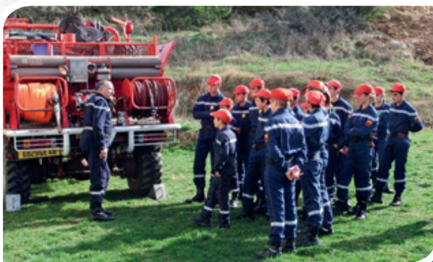
Jeunes Pompiers : briefing avant la pratique